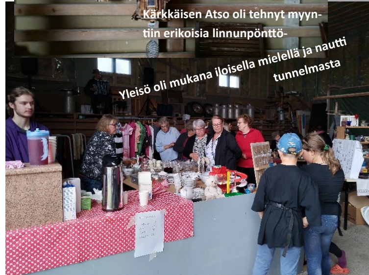
Yleisö oli mukana iloisella mielellä ja nautti tunnelmasta