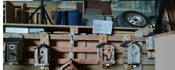
Kärkkäisen Atso oli tehnyt myyntiin erikoisia linnunpönttö-