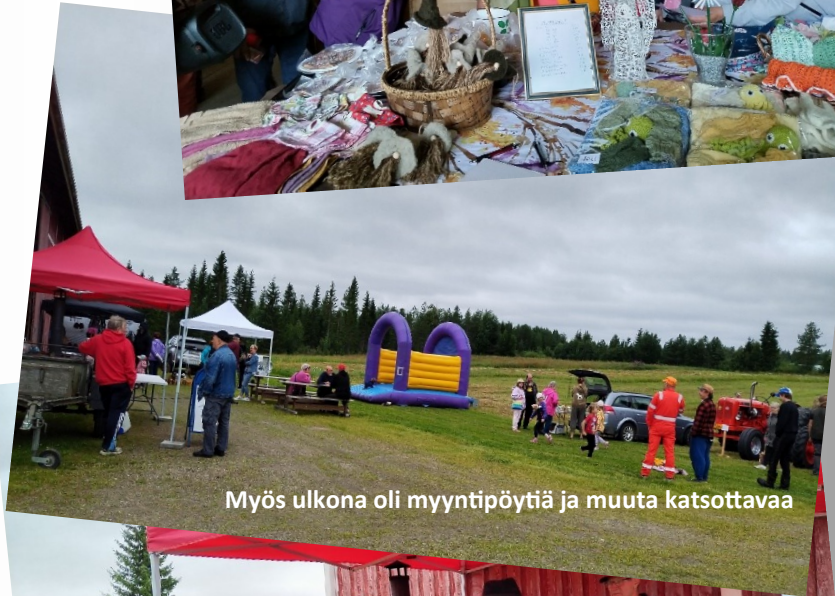
Myös ulkona oli myyntipöytiä ja muuta katsottavaa