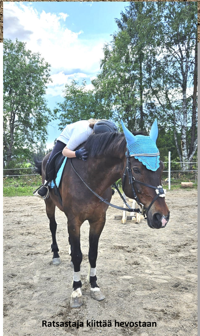
Ratsastaja kiittää hevostaan

Vaarantalonsa puitteiden ansiosta leiriläiset oli helppo majoittaa ja sieltä kulkeminen tallille ja takaisin oli sujuvaa pyörien ja innokkaan asenteen ansiosta. Innokas asenne näkyi myös tallilla, kun hevosia