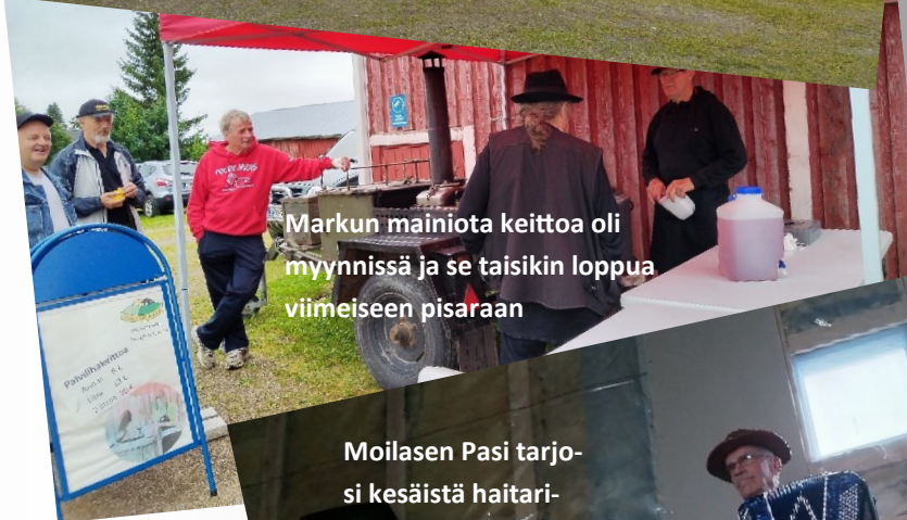
Markun mainiota keittoa oli myynnissä ja se taisikin loppua viimeiseen pisaraan