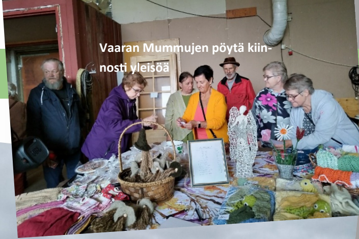
Vaaran Mummujen pöytä kiinnosti yleisöä

Ensi kesänä Rompetori järjestetään Vaarantalolla.